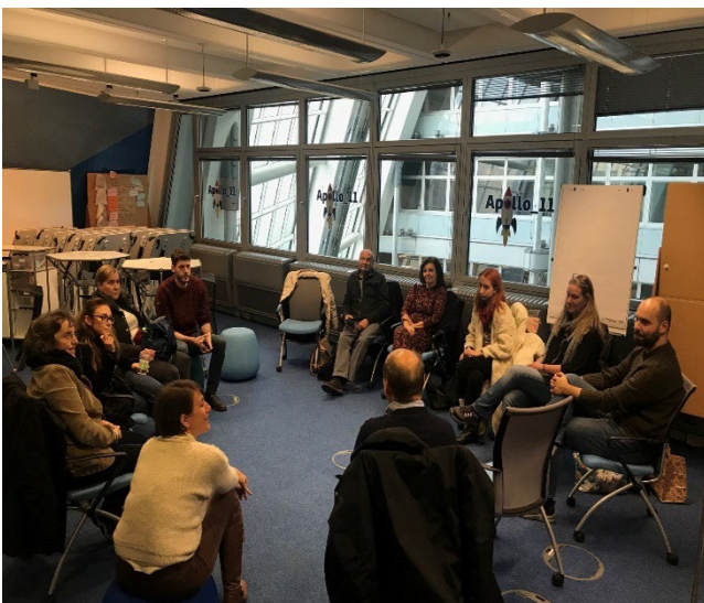
Image 2 Discussion à la Chambre de Commerce de Berlin

Sur la base du référentiel de bonnes pratiques, le consortium Meta-coin travaille actuellement à la création d'une plate-forme de travail structurée remplie de matériels de formation en méta-compétences et en compétences d'internationalisation accessibles aux niveaux 3 à 6 du CEC, offrant un parcours de perfectionnement. Plus précisément, les partenaires ont terminé le 2ème séminaire de travail et activité d'apprentissage entre pairs qui s'est déroulé à Berlin du 28 au 30 novembre, où ils ont travaillé sur la structure et la méthodologie du cours en ligne qui sera disponible sur le site Internet du projet. https://metacoinproject.eu/ .