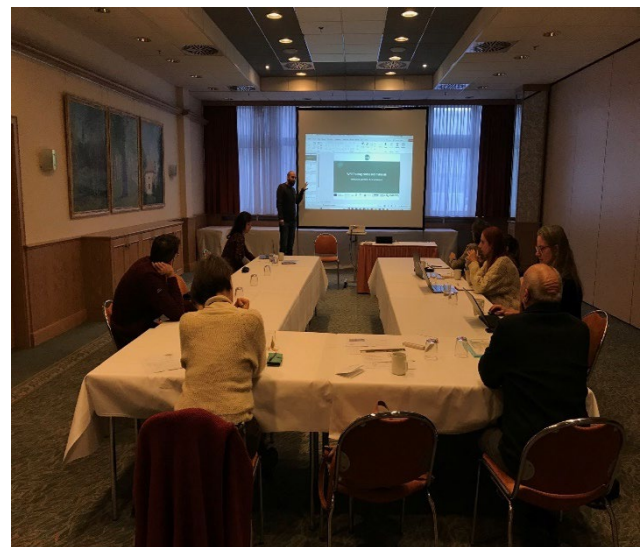
Image 3 La 3ème Rencontre des Partenaires Transnationaux

Le contenu de cette publication représente uniquement le point de vue de l'auteur et relève de sa seule responsabilité. La Commission européenne décline toute responsabilité quant à l'utilisation qui pourrait être faite des