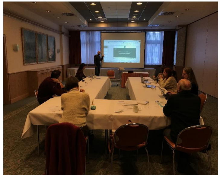
Kuva 3 Kansainvälisten yhteistyökumppaneiden kolmas kokous

Tämän julkaisun sisältö edustaa vain kirjoittajan näkemyksiä ja on yksin hänen vastuullaan. Euroopan komissio ei ota mitään vastuuta julkaisun sisältämien tietojen mahdollisesta käytöstä.