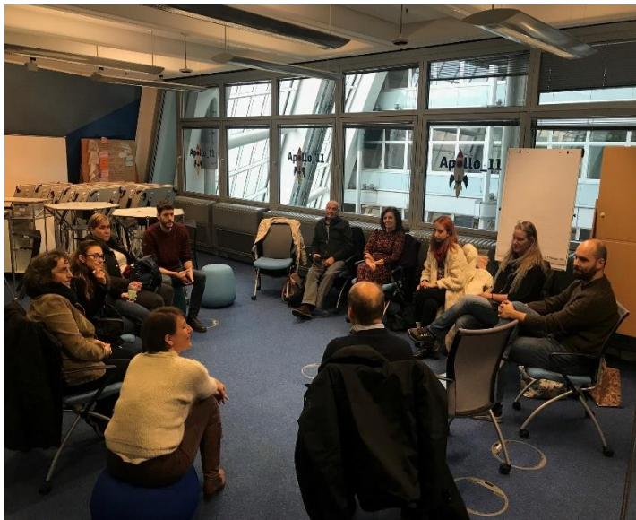
Kuva 2 Keskustelua Berliinin kauppakamarissa

META-COIN-konsortio työstää parhaillaan selvittämiensä hyvien käytäntöjen pohjalta jäsenneiltyä oppimisalustaa, joka tarjoaa runsaasti koulutusmateriaaleja meta- ja kansainvälisyystaitojen kehittämiseksi . Koulutusmateriaalit ovat saatavilla EQF-tasoilla 3–6 ja tarjoavat valinnaisen koulutusväylän. Yhteistyökumppanit ovat saaneet päätökseen Berliinissä 28.–30. marraskuuta pidetyn toisen työseminaarin ja vertaisoppimistapahtuman, jossa he työskentelivät META-COIN-projektin verkkosivuilla ( https://metacoinproject.eu/ ) julkaistavan verkkokurssin rakenteen ja metodologian parissa.